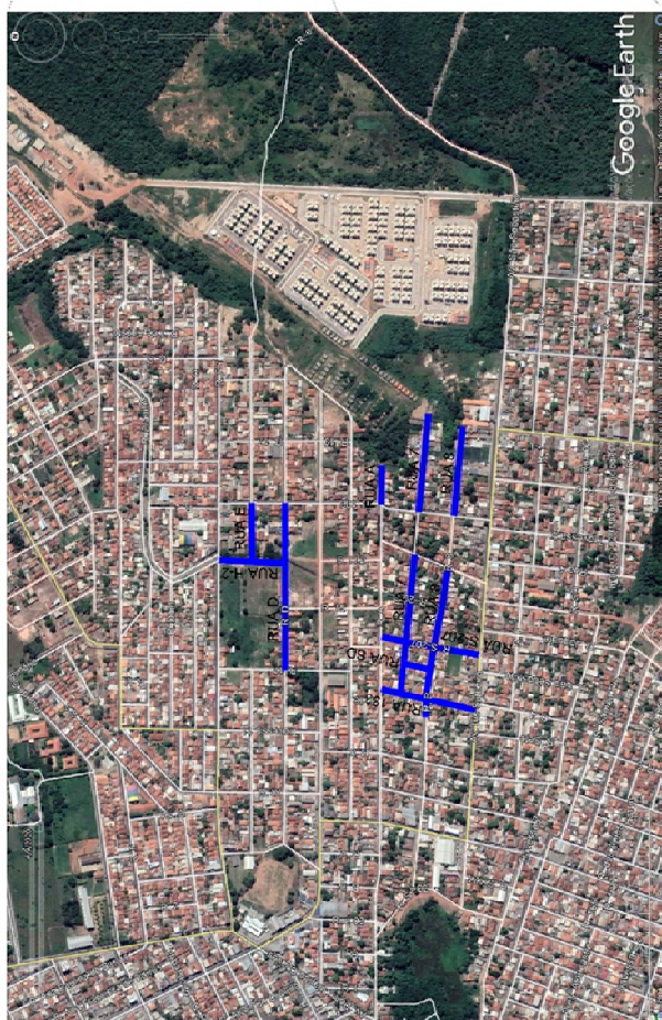
Bairro: Jardim Adalia - Várzea Grande - MT